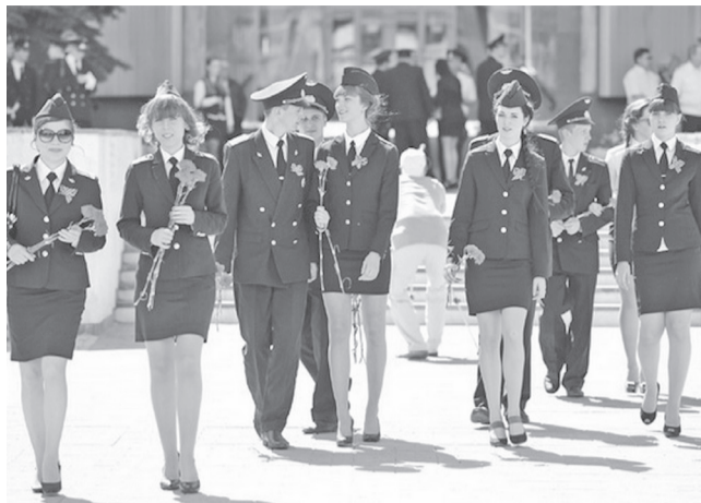
Рособрнадзор отказал Ульяновскому высшему авиационному училищу гражданской авиации в аккредитации образовательных программ: «Экономика и управление» (бакалавриат, специалитет), «Менеджмент» (высшее образование), «Менеджмент организации» (высшее образование).