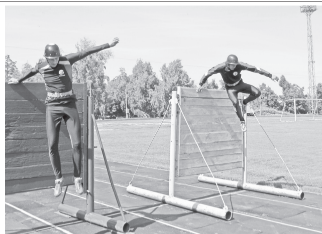
Димитровградская команда СПСЧ № 1 Специального управления № 87 на протяжении восьми лет занимает верхние ступени пьедестала по всей области. Не отвернулась удача и в открытом первенстве по пожарно-прикладному спорту, состоявшемся в Димитровграде в рамках празднования 25-летию МЧС России.