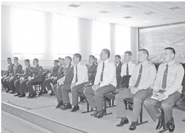
В Главное управление МЧС России по Ульяновской области прибыли 19 выпускников высших учебных заведений системы МЧС России. Молодые лейтенанты окончили Ивановскую пожарно-спасательную академию, Уральский и Воронежский институты.