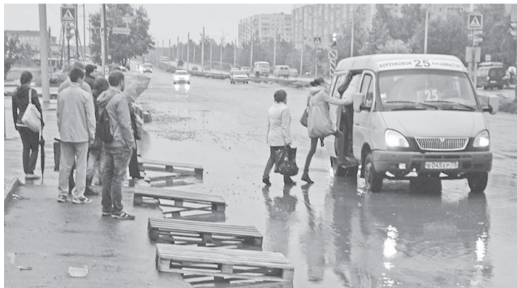
Уровень удовлетворенности населения работой городского транспорта зависит не только от уровня обслуживания и качества общественного транспорта, но и от качества дорог. К 2018 году его необходимо довести до 75 процентов

«Город будущего», как справедливо сказал Сергей Морозов, - это «город, в котором хочется жить, созидать и работать».