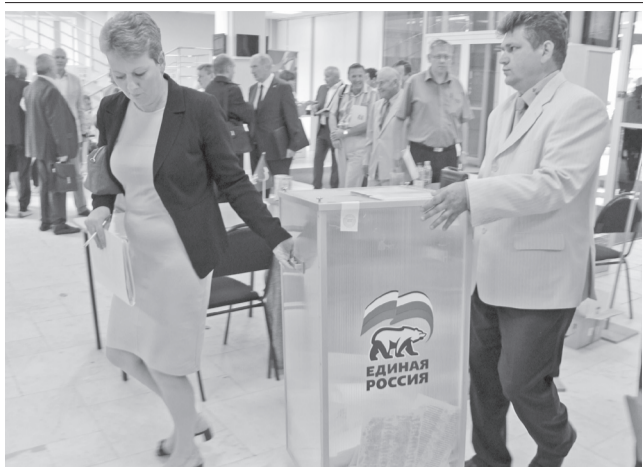
Продолжается выдвижение кандидатов для участия в выборах Ульяновской городской думы V созыва, которые состоятся в единый день голосования 13 сентября.