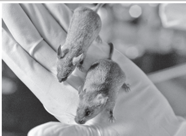
С начала текущего года мышиная лихорадка поразила 76 человек, среднее многолетнее значение при этом уступает числу заболевших в этом году на 20 человек. Только с начала июля в Ульяновске зарегистрировано 15 случаев заболевания людей лихорадкой.